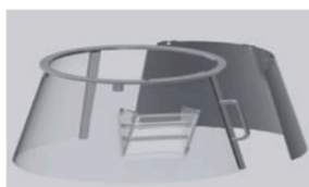
Protezione fissa/girevole in plastica "F" Fixed rotating plastic safety guard "F"