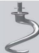
Spirale in alluminio Aluminium spiral