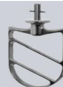
Spatola in alluminio Aluminium beater