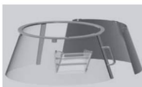
Protezione fissa/girevole in plastica "F" Fixed rotating plastic safety guard "F"