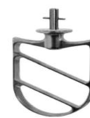
Spatola in alluminio Aluminium beater